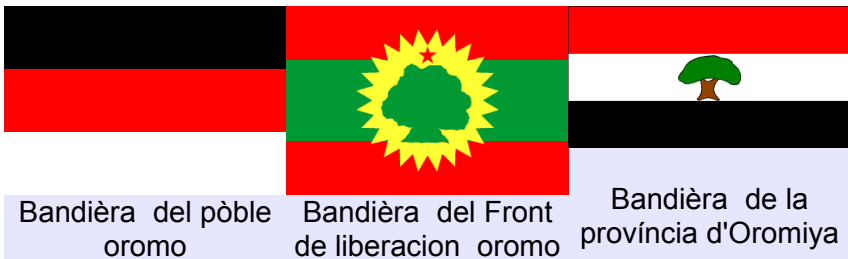
Bandièra del pòble oromo

La cultura dels oromos se basa sus gadaa , ensems de rèulas socialas e politics. La religion tradicionala, waaqgefannaa (cresença en un dieu unenc, Waaqa ) es estada remplaçada pel cristianisme etiopian e per l'islam, segond las regions.